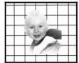
5. Head very high over the horizontal line, almost vertical position.